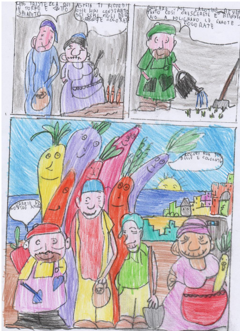
Classi 2 ^ A e 2 ^ B Rosaria Scardigno